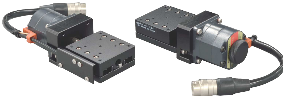
自動 X ステージ ALS-401-HM-T